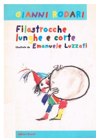
Rodari (Altan), I viaggi di Giovannino Perdigiorno , Einaudi Ragazzi – Rodari (Munari), Filastrocche in cielo e in terra , Einaudi – Rodari (Luzzati), Filastrocche Lunghe e corte , Editori Riuniti