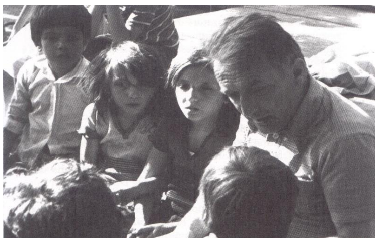
Gianni Rodari tra i "suoi" giovani lettori

Essere un'appassionata studiosa di Gianni Rodari e proporre un progetto di educazione alla lettura 1 nella scuola primaria, mi hanno stimolata a effettuare una "mini-ricerca esplorativa" per valutare la ricezione delle filastrocche rodariane nei bambini di oggi.